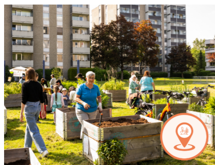
› GARTENINSELN OST + WEST