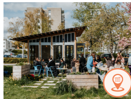
› KIOSK „ZUR FÜRSTIN“

Der Kiosk „Zur FÜRstin“ hat dienstags & mittwochs von 8 bis 18 Uhr für Sie geöffnet. Es gibt Heißgetränke, belegte Semmeln, Panini und Süßigkeiten. Viele der Aktionen vom Nachbarschaftstreff finden hier statt.