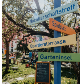
Neue Außenbereiche laden zum Bewegen, Verweilen und Begegnen ein

Die Außenanlagen in FÜRstenried West sollen Schritt für Schritt weiterentwickelt werden. Ziel ist es, das Quartier klarer zu strukturieren und die Flächen abwechslungsreicher, grüner und besser nutzbar zu machen – für Bewohner:innen und Gäste. Geplant sind vier kleinere Begegnungspunkte, sogenannte Quartierstreffs.