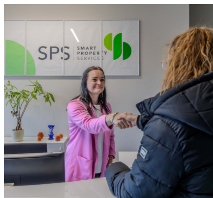
MIETER:INNENSPECHSTUNDEN JEDEN MONTAG UND FREITAG