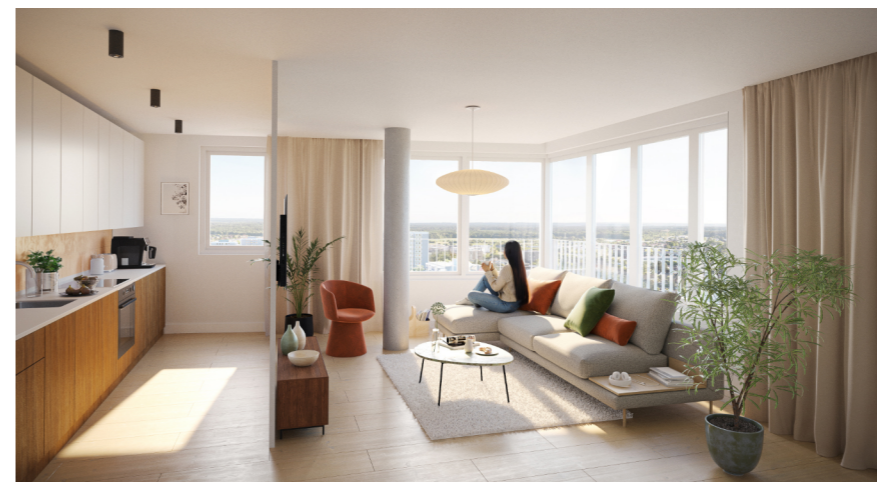
BERGBLICK & BERGGARTEN: Neue Wohnungen für ein wachsendes Quartier

In Haus Rotondo und Haus Öhrli sind die ersten Mieter:innen eingezogen – und das Quartier wächst weiter zusammen.