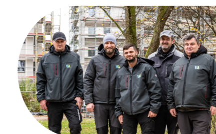
IMMER VOR ORT: DAS NEUE TEAM DER HAUSMEISTER

Außerdem kümmern wir uns um die Garteninseln, bauen Tauschregale und Bücherschränke. In unserer Hand liegt auch der Betrieb des Kiosks. Melden Sie sich, wenn Sie gerne den Kiosk oder den Nachbarschaftstreff mieten möchten.