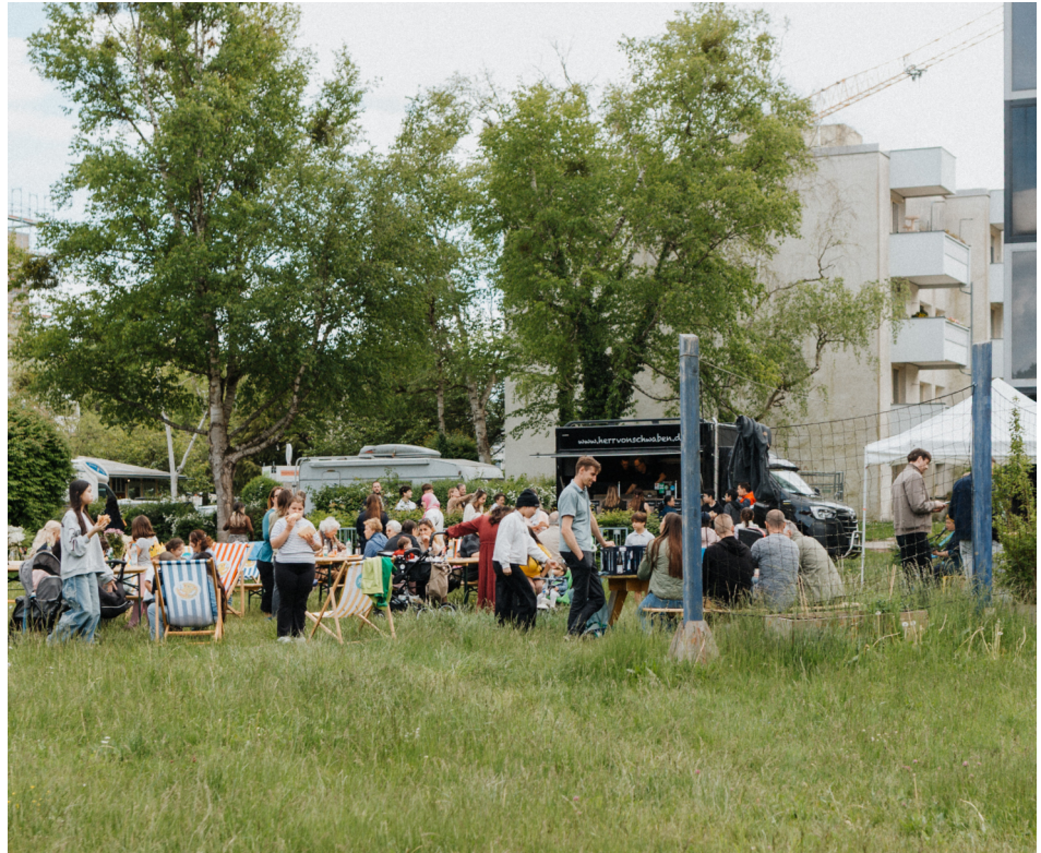
Ein schöner Frühsommertag bei unserem diesjährigen Gartenfest an der Garteninsel

Mehr Infos unter: WWW.FUERSTENRIEDWEST.DE