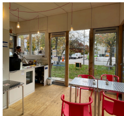
UNSER KIOSK „ZUR FÜRSTIN“ KANN ANGEMietet WERDEN!

Seit Januar 2025 bieten wir Ihnen zweimal wöchentlich Mieter:innensprechstunden im Nachbarschaftstreff, Appenzeller Straße 111: Montag 14 bis 18 Uhr und Freitag 9 bis 13 Uhr . Kommen Sie gerne vorbei! Wir freuen uns darauf, Sie kennenzulernen.