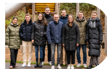
DEN ÜBERBLICK BEHALTEN: DAS QUARTIERSMANAGEMENT

Herzlich Willkommen im Quartier FÜRSTENRIED WEST! Wir kümmern uns um Ihre Belange und stehen Ihnen jederzeit zur Verfügung, um Fragen zu beantworten und bei Bedarf Hilfe zu leisten. Wir sind stolz, Teil des Quartiers FÜRSTENRIED WEST zu sein und freuen uns darauf, Sie kennenzulernen.