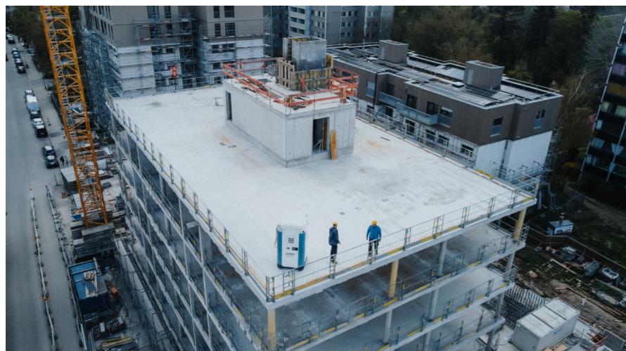
Baustelle am künftigen Quartiersplatz im Sommer 2026

Mit Treffpunkten, Gastro, Nahversorgung und Dachterrasse entsteht das neue lebendige Zentrum für FÜRstenried West.